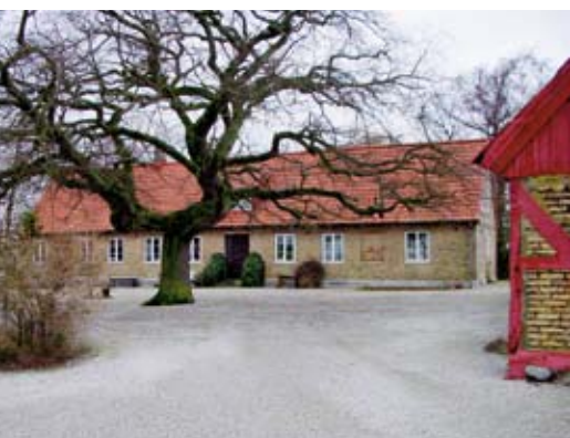
Sexdelade, kors- eller T-postfönster. Fasta poster och spröjs. Fönster på jämna avstånd. Likstora fönster.

Även ekonomibyggnadernas konstruktioner utvecklades under denna period och byggnaderna ökade volymmässigt, både på bredden och höjden. De nya konstruktionerna och tegelmurarna gav byggnaderna ett mer stramt och propert intryck. Genom att man undvek att putsa teglet blev också fasaderna lättskötta. För att förbättra hygien i djurstallarna ökades antalet fönster genom småspröjsade gjutjärnsfönster. Vindsutrymmet ovanför stallet, höskullen, blev i takt med den ökade produktionen av djurfoder högre under denna period. Ladorna gjordes enkla och oisolerade. Väggarna bestod av rödmålad, gles panel. För ventilationens skull fick taken också ofta huvar, som placerades längsnocklinjen.