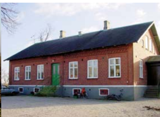
Bostadshuset är en våning höga och har från fasadlivet lätt indragna pardörrar. Enkel dekormurning. Taken saknar takkupor.