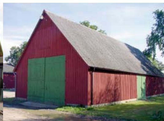
Höga rödmålade lador i trä med gröna slagportar.