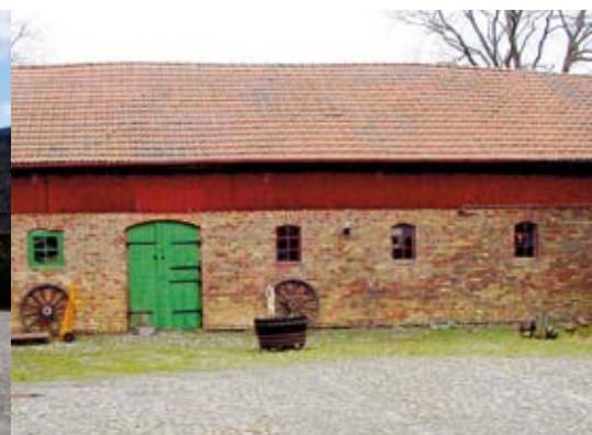
Fönster i gjutjärn. Skullväggar klädda med rödmålad panel. Panel med spetsig eller rundbågig avslutning.