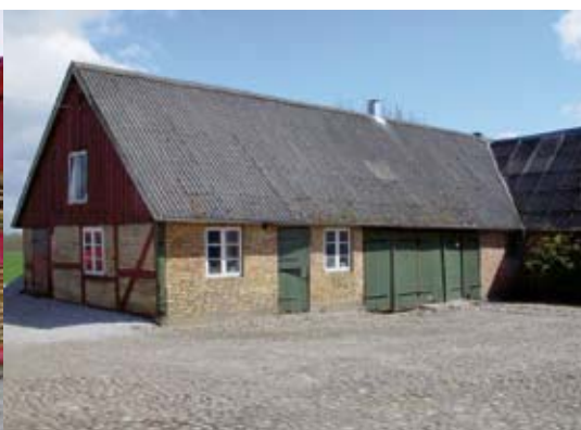
Sadeltak. Kullerstensbelagda gårdar.