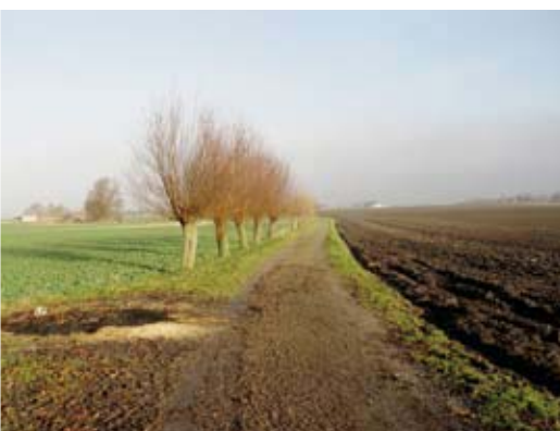
Stora sammanhängande åkerytor med rätvinkliga vägar. Pilerader längs vägar och ägo gränser.